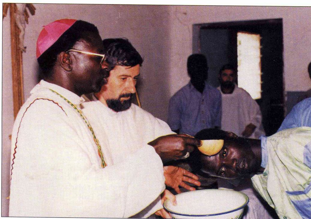
...e i figli di Dio...

preghiera giornaliera del Rosario (le tre corone) familiare e personale, la lettura quotidiana della Bibbia in famiglia e la frequenza ai sacramenti. Mezzi che il demonio, suo malgrado, è stato costretto dal Signore e dalla Madonna a confermare in numerosi esorcismi e che cerca di eliminare o ridimensionare, mediante i suoi "figli", con