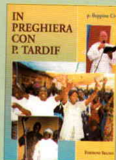
In preghiera con p. Tardif di p. Beppino Cò Edizioni Segno pp. 216 - L. 15.000 - € 7,75

La Madonna, Madre della Sapienza, ci insegna a pregare con fede e costanza (soprattutto il Santo Rosario) per ottenere le grazie spirituali e fisiche necessarie per la nostra vita, per quella dei nostri familiari e per quanti si affidano alle nostre preghiere. L'efficacia delle preghiere di liberazione e di guarigione nella nostra quotidianità è direttamente proporzionale alla recita col cuore del Rosario ed alla frequenza dei sacramenti. La ragione è assai comprensibile: Dio non cerca clienti, ma credenti. Il Signore ci vuole concedere le grazie, ma soprattutto desidera donarci la grazia più importante: il Paradiso. Per raggiungerlo, il Signore permette spesso delle prove che solo grazie all'aiuto della preghiera personale e comunitaria, è possibile sopportare con la speranza che "questo povero grida e il Signore lo ascolta, lo libera da tutte le sue angosce" (Sal 34,7) - "Molte sono le sventure del giusto, ma lo libera da tutte il Signore. Preserva tutte le sue ossa, neppure una sarà spezzata" (Sal 34,20).